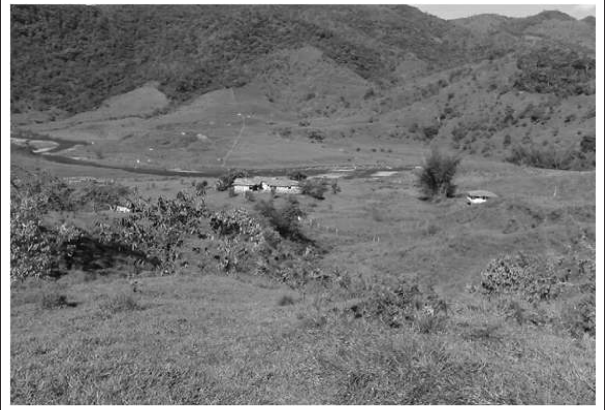
Panorámica vereda Tocaima