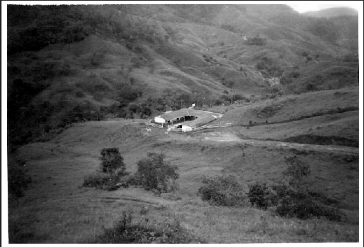
Panorámica vereda El Popo