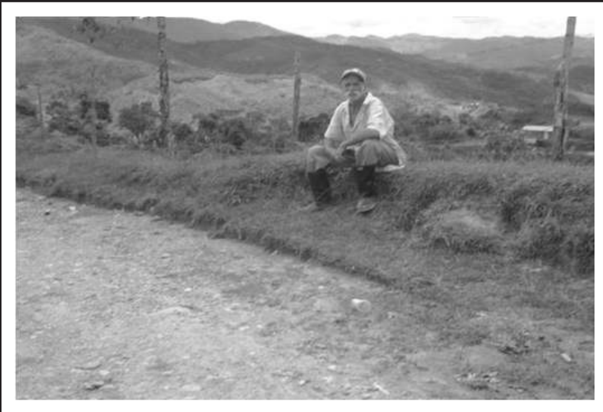
Panorámica vereda Cruces

La vereda Cruces cuenta con uno de los miradores naturales más hermosos del municipio "El Alto de Cruces" que es el que más área permite observar