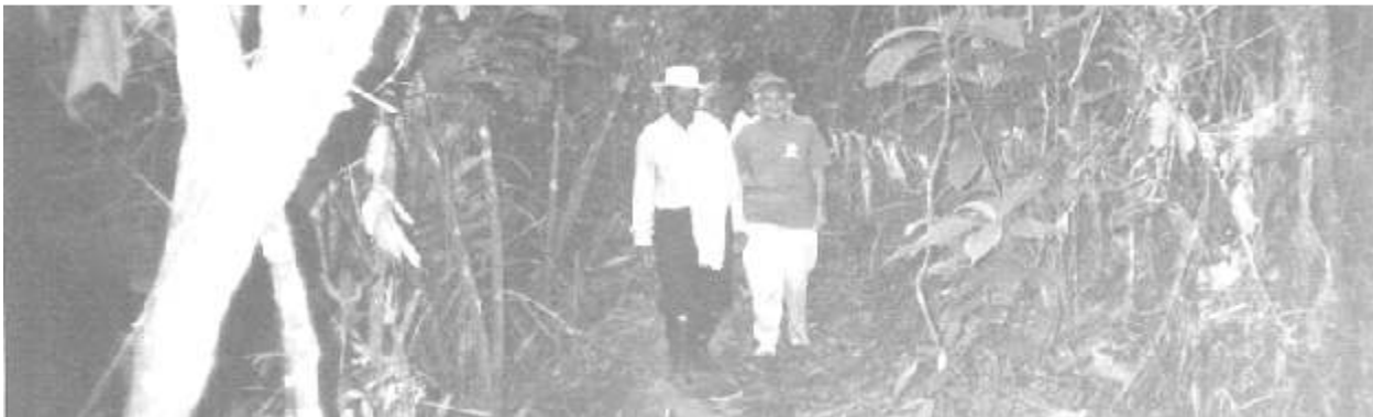
Camino viejo Vereda El Popo