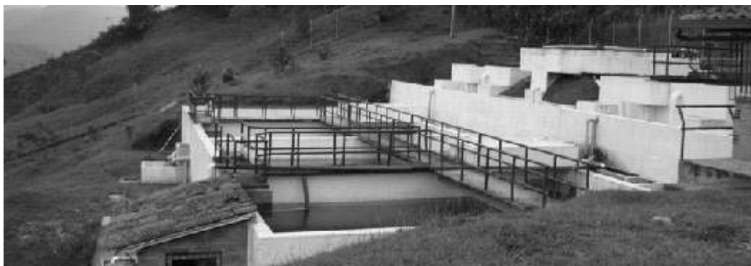
Planta Municipal de Tratamiento de agua potable