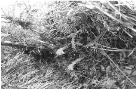
Antigua acequia ya destruída, tapada con maleza

La vereda San Pedro está casi deshabitada, todas las familias que pertenecieron a esta vereda viven en la zona urbana, algunos tienen sus fincas por su cercanía a la cabecera municipal en la mañana emprenden el viaje con su herramienta, su fiambre en bestia o a pié a trabajar sus tierras, regresan en la tarde al municipio a descasar y compartir con sus familias.