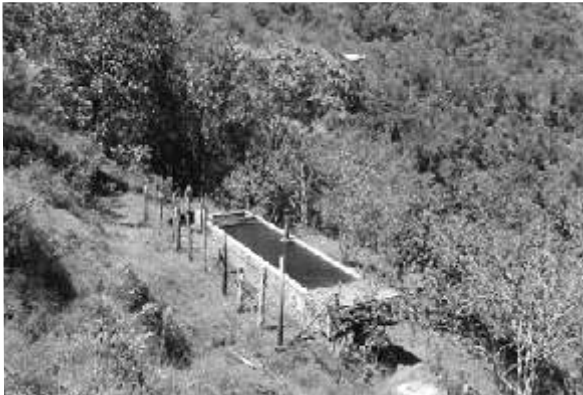
Tanque de abastecimiento de la bocatoma

Las quebradas Florida y San Pedro abastecen el municipio con sus aguas. La Florida en el área Nudillales nos surte el agua para el Balneario y los guajes, la San Pedro donde se encuentra la bocatoma abastece el Municipio. Desde este punto llega el agua que todos los alejandrinos utilizamos. La compra de terrenos por parte del municipio para la protección de las cuencas también ha hecho que las familias emigren de esta vereda. Anteriormente el agua corría por la acequia y los campesinos de esta vereda siempre estaban atentos a su limpieza.