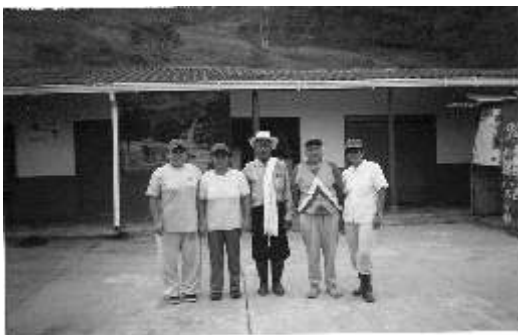
Escuela vereda El Popo