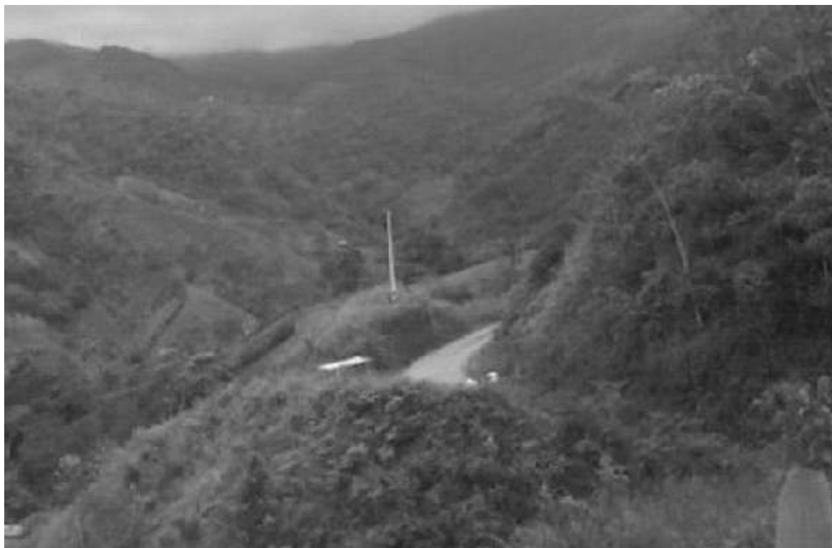
Panorámica vereda El Popo