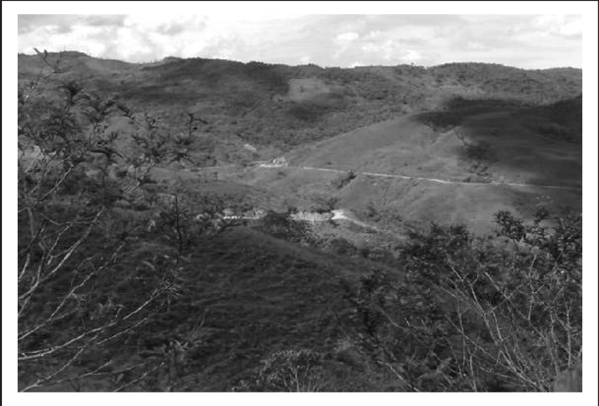
Panorámica vereda La Pava