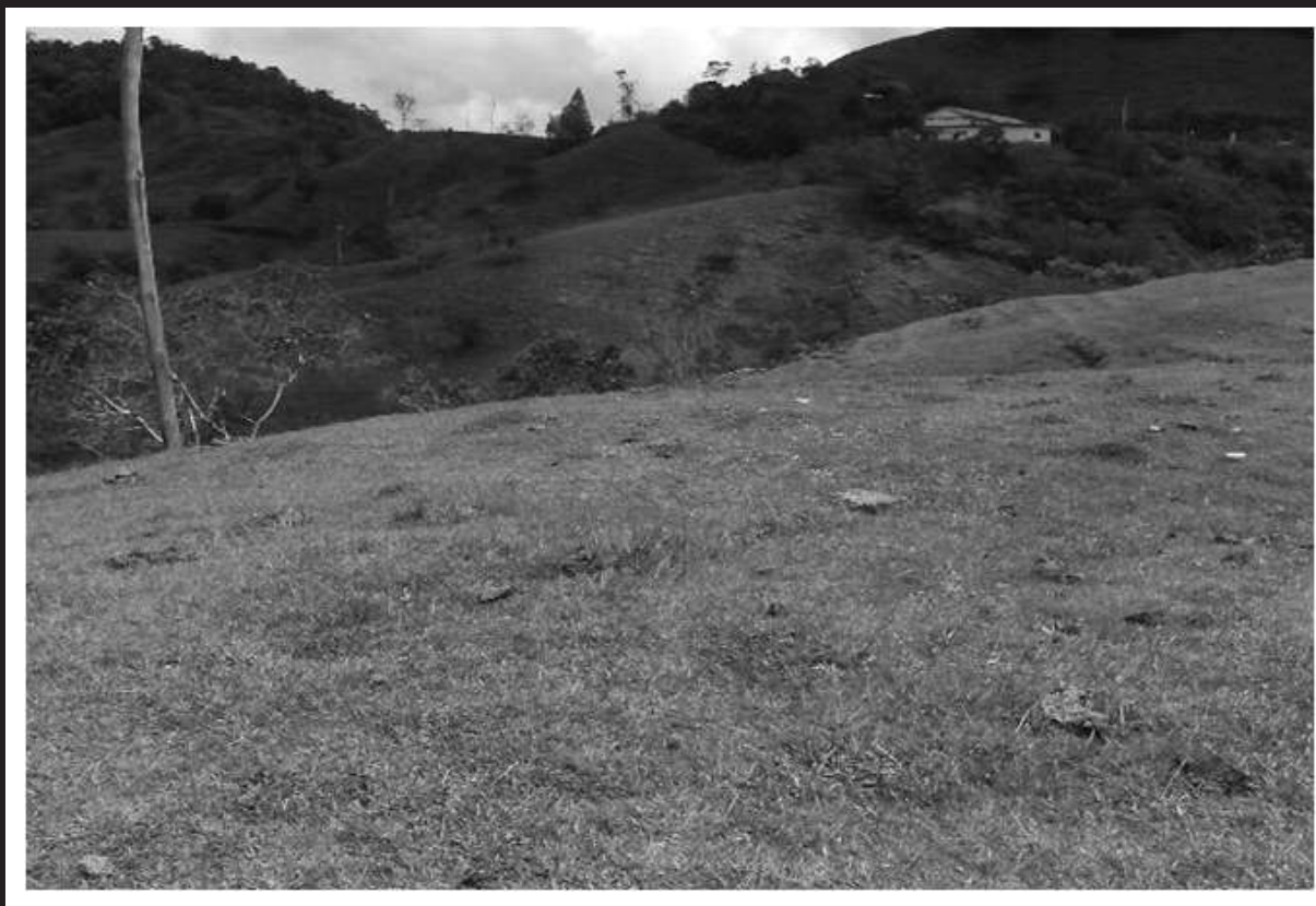
Panorámica vereda Tocaima