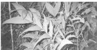
Árbol el Popo